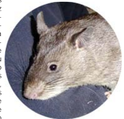
Gambian pouched rat

Em 9 de Abril de 2003, um carregamento de 762 roedoras exóticas originárias de Acra, Gana, chegou aos Estados Unidos. Essa transferência continha ratos de sacos gigantes da Gâmbia (50 animais), esquilos corda (53), porco-espinhos (2), esquilos árvore (47), ratos com riscas (100), e arganaz (510). Acompanhando estes animais Texas estava um vírus inesperado que finalmente encontrou o seu caminho em pelo menos duas outras espécies animais, nos Estados Unidos (cães pradaria e seres humanos) e se espalham pelo menos em seis outros estados. O inesperado agente que, anteriormente não foi visto nos Estados Unidos, era um membro do grupo conhecido como macacos ortopoxvírus (CDC, 2003b). Deu um susto para a saúde pública e segurança a infra-estrutura interna, já em estado de maior consciencialização para a variola, e desafiaram a capacidade para enfrentar uma ameaça emergente de saúde nos Estados Unidos que não foi convenientemente cair sob o domínio de uma única agência federal.